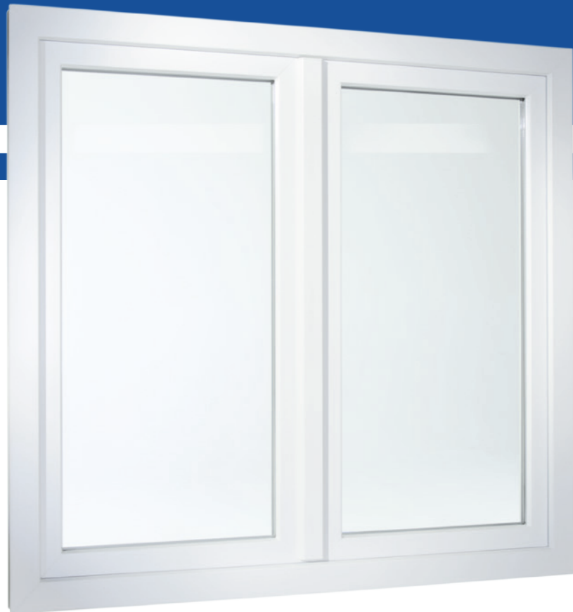
2-flügeliges Fenster flächenversetzt